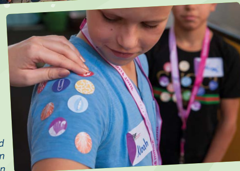
Bekannte und verborgene Stärken entdecken