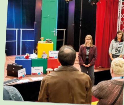
Eltern informieren sich am Elternabend

Wenn Sie Fragen zum Inhalt, zum Ablauf oder zu Formalien haben, melden Sie sich bitte bei uns: Sinus – Büro für Kommunikation GmbH, E-Mail: schulen.sh@sinus-bfk.de, Telefon: 0221 27 22 55-123