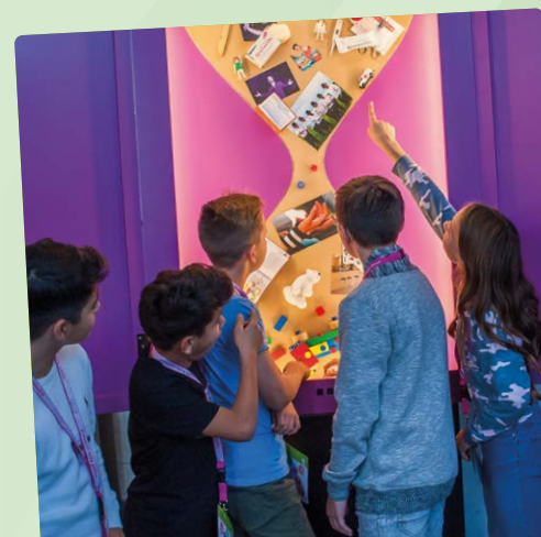
Auswertung: Welche Stärken passen zu welchem Berufsfeld?