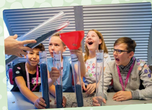
Aufgaben lösen mit Blick in die Zukunft