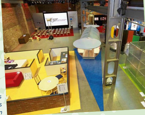
Der Parcours mit den sechs Stationen