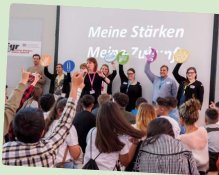
Beteiligte Akteurinnen und Akteure im Parcours