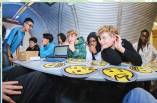
Zeittunnel „Ich schau und höre in meine Zukunft“ - Gestaltung von Lebens- und Arbeitswelten