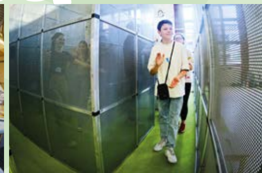
Labyrinth „Ich finde mich zurecht“ - Orientierung für den Berufsweg und die eigene Lebensplanung