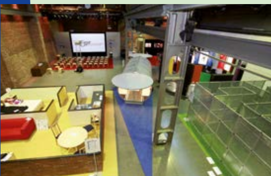
Stärken-Parcours „Meine Stärken, meine Zukunft“

Im Vorfeld der jeweiligen regionalen Maßnahme werden die Agentur für Arbeit, das Schulamt sowie die Kreisfachberatung für Berufliche Orientierung zu einem Abstimmungsgespräch eingeladen.