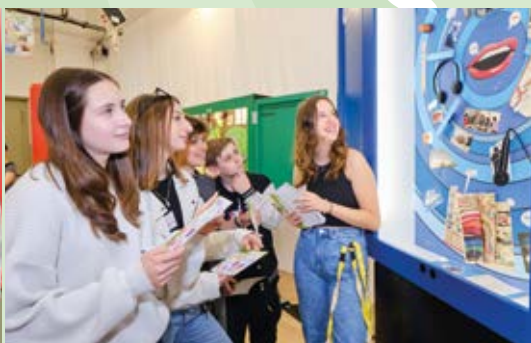
Stärken-Schrank „Mein Reden“ Gerne reden, beraten, verkaufen