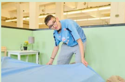
Sturmfreie Bude „Ich hab's drauf“ – Wahrnehmung von Kompetenzen