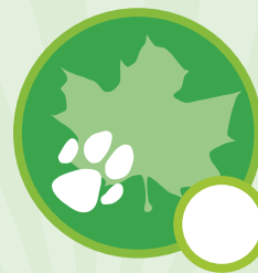
Mein tierisch grüner Daumen