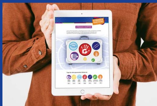
„Welche Stärken passen zu mir?“ – der persönliche Stärkenkoffer