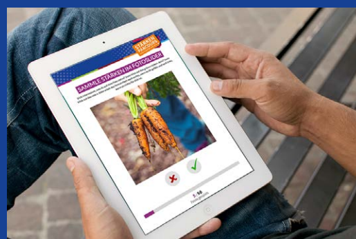
Stärkenslider „Welche Tätigkeiten sprechen mich an?“