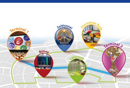
2021 als Digitaler Stärken-Parcours

Gemeinsam mit der Agentur für Arbeit, dem Schulamt sowie den Kreisfachberaterinnen und Kreisfachberatern für Berufliche Orientierung werden weitere regionale Akteurinnen und Akteure der Beruflichen Orientierung und Lebensplanung im Vorfeld zu einem Abstimmungsgespräch eingeladen. Dabei wird unter anderem die Mitwirkung der regionalen Partnerinnen und Partner an den jeweiligen Veranstaltungen vereinbart und die Einbettung des Moduls in die schulischen Konzepte abgestimmt. Zum Abschluss werten alle Beteiligten das Projekt aus und diskutieren Perspektiven.