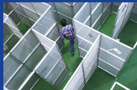
„Ich finde mich zurecht“ – Orientierung für den Berufsweg und die eigene Lebensplanung