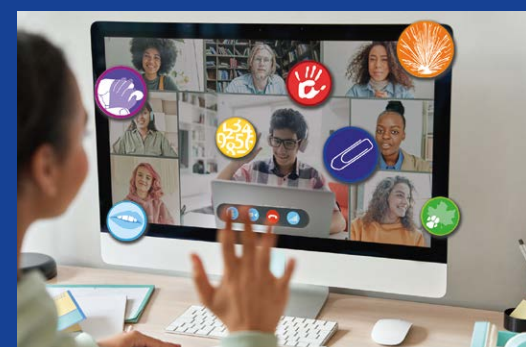
Beim Stärken Ping-Pong bestärken sich die Jugendlichen gegenseitig